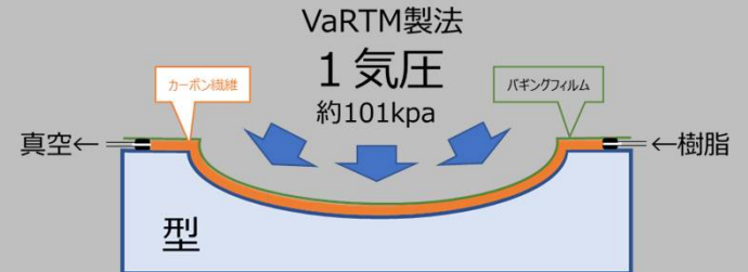
工法の簡易模式図

型にカーボン繊維を貼り込み、バッキングフィルム等で密封し、真空にし、樹脂を注入、含浸して硬化させる。